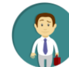
PENGEMBANGAN KEPROFESIAN BERKELANJUTAN