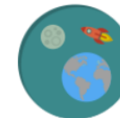
WAHANA JELAJAH ANGKASA