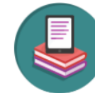
BUKU SEKOLAH ELEKTRONIK