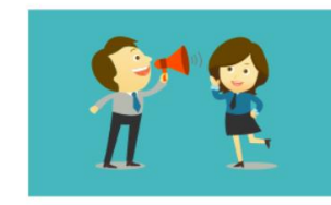
KARYA BAHASA DAN SASTRA